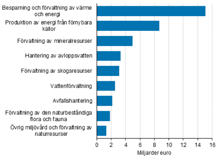
Figurbilaga 1. Omsättning inom miljöaffärverksamhet 2020, miljarder euro